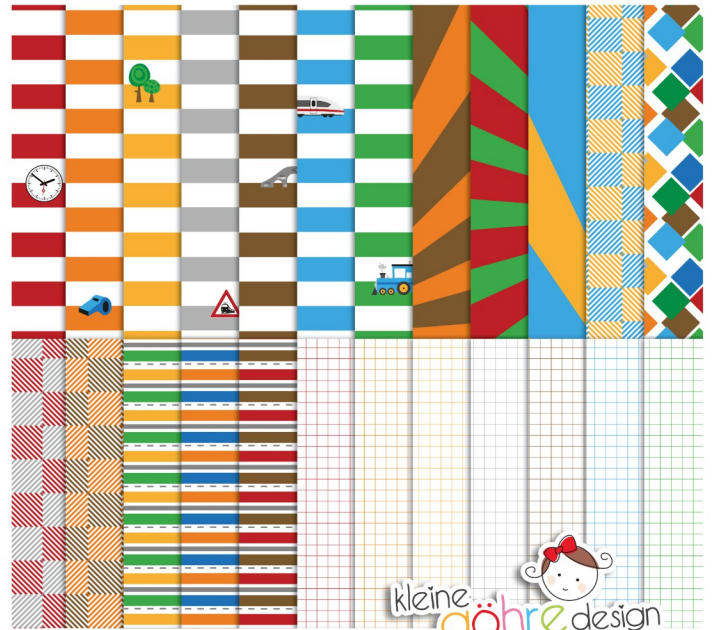
digitale Papiere "Tschu Tschu Streifen&Co."