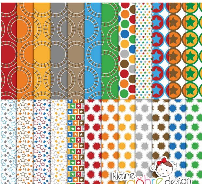
digitale Papiere "Tschu Tschu Punkte&Co."